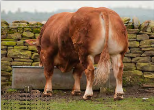
100 gün Canlı Ağırlık: 219 kg 200 gün Canlı Ağırlık: 407 kg 300 gün Canlı Ağırlık: 588 kg 400 gün Canlı Ağırlık: 788 kg 500 gün Canlı Ağırlık: 968 kg