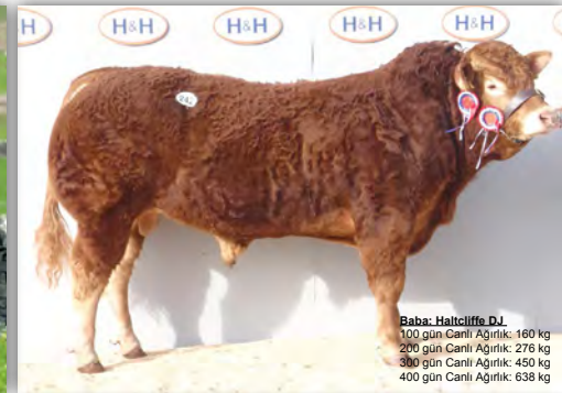
Baba: Haltcliffe DJ 100 gün Canlı Ağırlık: 160 kg 200 gün Canlı Ağırlık: 276 kg 300 gün Canlı Ağırlık: 450 kg 400 gün Canlı Ağırlık: 638 kg