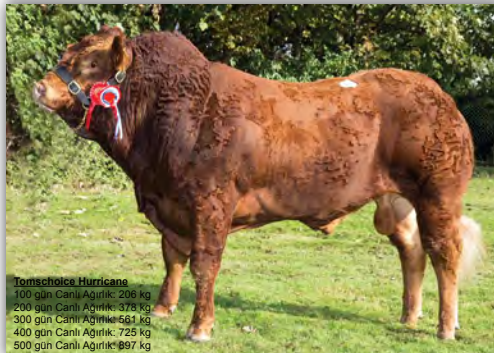
Tomschoice Hurricane 100 gün Canlı Ağırlık: 206 kg 200 gün Canlı Ağırlık: 378 kg 300 gün Canlı Ağırlık: 561 kg 400 gün Canlı Ağırlık: 725 kg 500 gün Canlı Ağırlık: 897 kg