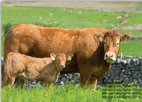
B. Bulm (dişi) 100 gün Canlı Ağırlık: 176 kg 200 gün Canlı Ağırlık: 316 kg 300 gün Canlı Ağırlık: 416 kg 400 gün Canlı Ağırlık: 537 kg